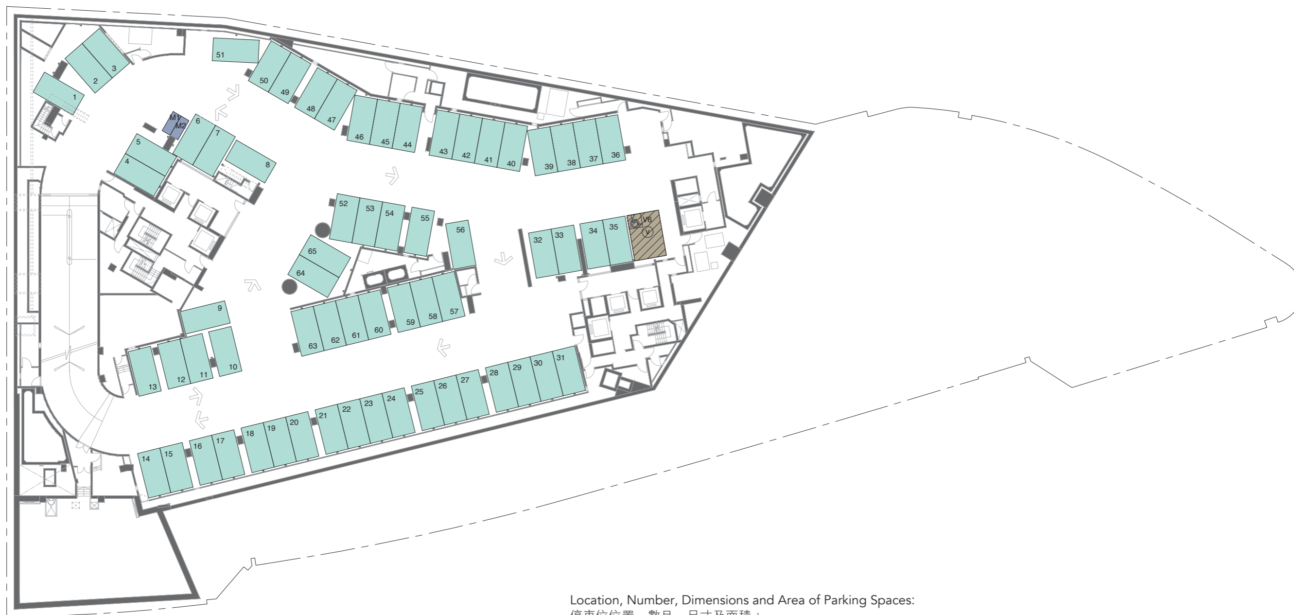
Location, Number, Dimensions and Area of Parking Spaces: 停車位位置、數目、尺寸及面積：